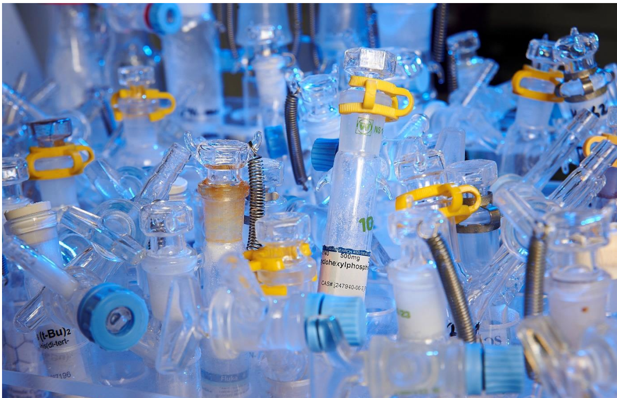
Abb. 1: In sog. Schlenkgefäßen werden neue luft- und wasserempfindliche Katalysatoren unter Schutzgasatmosphäre hergestellt und gelagert.