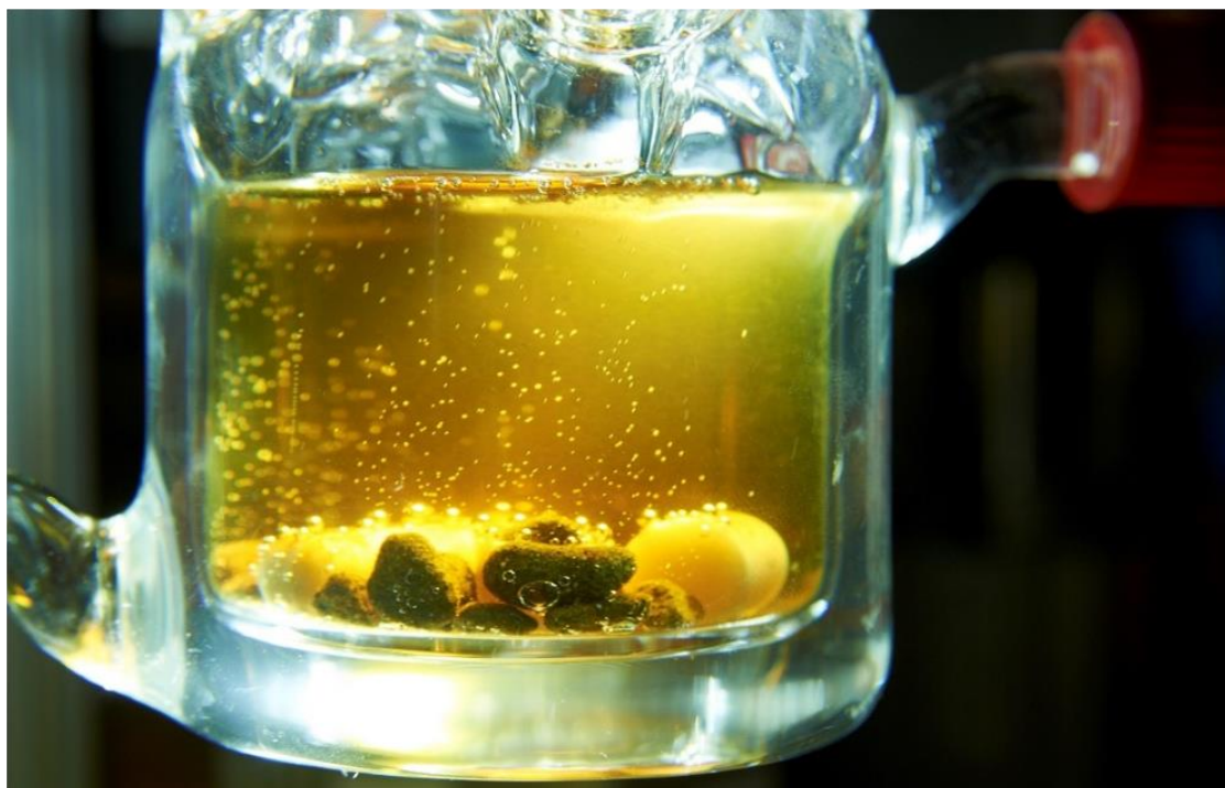
Abb. 2. Oben: Kaskadenreaktion – Die katalysierte Freisetzung des Wasserstoffs aus einer wässrigen Methanollösung erfolgt in mehreren Schritten und durchläuft verschiedene Intermediate. Unten: Wasserstofffreisetzung an immobilisierten Katalysator im Reaktor - Mechanistische Untersuchungen finden im Labormaßstab statt.